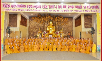
Chư Tôn đức Hộ pháp và các Sa-di-ni, tập sự khóa tu lần 4, năm 2018.