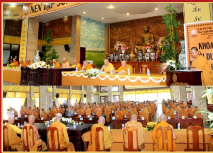
Chư Tôn đức Giáo phẩm Hộ pháp chứng minh Lễ Khất thực Khóa Bồi dưỡng Đạo hạnh lần thứ 4, năm 2018.