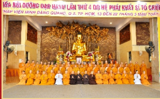
Chư Tôn đức Hộ pháp và các Sa-di, tập sự khóa tu lần 4, năm 2018.