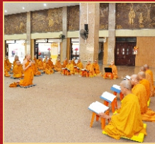
Tăng Ni thọ trong giờ tụng tụng Chơn lý.