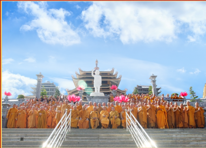
Chư Tôn đức Tăng Ni Hộ pháp chấp bình lục niệm cúng các hành giả khóa bồi dưỡng Đạo hạnh lần 4, năm 2015.