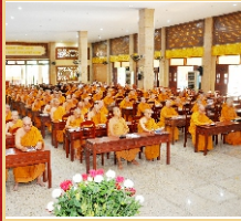
Các hành giả trong thời học pháp.