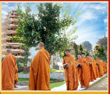
Hành giả trong nghi thức khất thực.

Với mục đích trợ duyên cho các Sa-di, Sa-di-ni, tập sự xuất gia, thăng tiến trên con đường tu học, cũng như hướng dẫn các pháp tác oai nghi cần bản cho các vị mới bước chân vào đạo, chư Tôn đức Giáo phẩm Hộ pháp mỗi năm mở một khóa Bồi dưỡng Đạo hạnh tại Pháp viện Minh Đăng Quang - Trung tâm Văn hóa, Tu tập của Hộ pháp. Thời gian tổ chức thường vào cuối tháng 6 (âm lịch) trước khi bắt đầu Lễ Từ tu Vu lan. Được thực hiện từ năm 2015, tính đến nay Hộ pháp đã tổ chức bốn khóa. Mỗi khóa kéo dài 7 ngày, có khoảng 200 - 250 hành giả tân học từ các Giáo đoàn về tham dự. Thời khóa tu học miễn phí từ 4h00 đến 22h00, với các thời tụng kinh, thiền tập, thiền hành, học pháp, pháp đàm giải nghi, chia sẻ kinh nghiệm tu tập, ôn Kinh Luật, Chơn lý, thọ thực chánh niệm và sám hối. Khóa tu đã mang lại niềm hoan hỷ, tin tưởng cho chư Tôn đức lãnh đạo và lòng kiên định, tinh tấn đối với các hành giả, phụng sự viên.