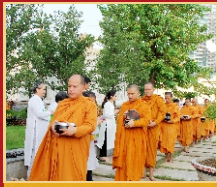
Hành giả trong nghi thức khất thực.