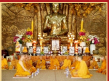
Chư Tôn đức Giáo phẩm Hộ pháp chứng minh Lễ Khất thực Khóa Bồi dưỡng Đạo hạnh lần thứ 2, năm 2016.