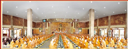
Các hành giả khóa tu nhận tiền chi nguyện trước giờ thọ trai.