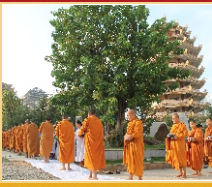
Hành giả trong nghi thức khất thực.