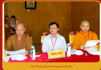
Ban Thư ký đưa kế chương trình hội thảo