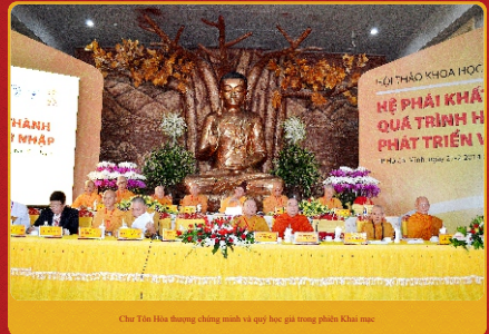
Chư Tôn Hòa thượng chứng minh và quý học giả trong phiên Khai mạc