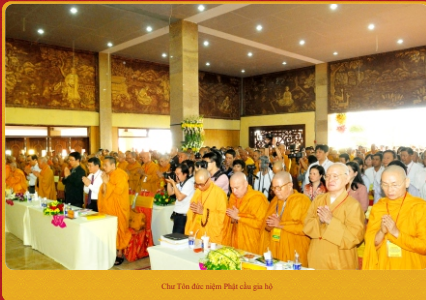
Chư Tôn đức miền Phật của gia họ

Bản chủ đề lớn được hội thảo nghiên cứu: 1) Tổ sư Minh Đăng Quang: Cuộc đời và đạo nghiệp; 2) Tư tưởng Phật học của Tổ sư Minh Đăng Quang trong bộ Chơn lý; 3) Phật giáo Khất sĩ: Quá trình hình thành và phát triển; 4) Hệ phái Khất sĩ và sự nghiệp xây dựng Giáo hội Phật giáo Việt Nam hiện nay. Hội thảo đã được sự hưởng ứng của hàng trăm học giả trong nước, nghiên cứu về một Hệ phái Phật giáo nội sinh, dung hòa giữa hai hệ tư tưởng Phật giáo lớn - Bắc truyền và Nam truyền, tạo nên một sắc thái riêng biệt của Phật giáo Việt Nam.