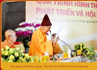
Hòa thượng Thích Đức Nghiệp - Phó Pháp chủ GHPGVN trình bày tham luận