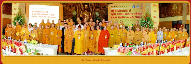
Chư Tôn đức chụp hình lưu niệm