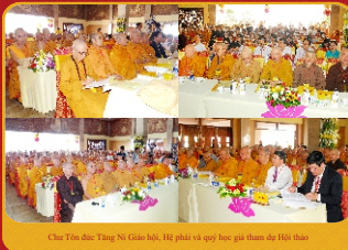
Chư Tôn đức Tăng Ni Giác họ, Hệ phái và quý học giả tham dự Hội thảo