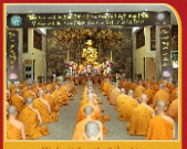
Hình ghi thực tập thiền tọa, thiền quán trong giờ thiền tọa.

Số lượng hành giả mỗi khóa trung bình từ 130 - 150 vị. Chư vị Giáo phẩm các Giáo đoàn luân phiên về tham gia công tác Kiểm soát, hỗ trợ cho khóa An cư được thành tựu. Các vị giảng sư Trung ương, TP. Hồ Chí Minh và Hệ phái đều được trân trọng cung thỉnh, trung bình mỗi khóa từ 15-20 vị. Nội dung giảng giải chủ yếu là Pháp học và Pháp hành, thúc đẩy hành giả tu tập để đạt được bốn nguyên của mình.