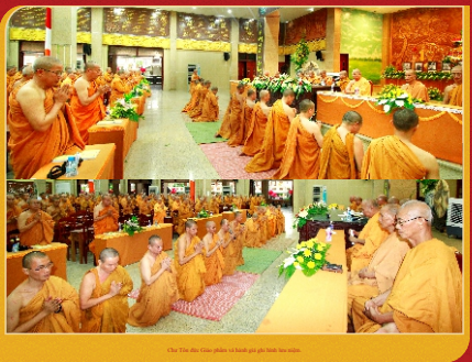
Đại chúng ghi hình học tập và ghi hình khóa học.