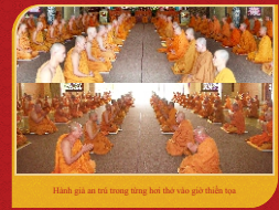
Hình ghi an cư trong thời giờ tọa và giờ thiền tọa.