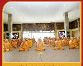
Hình ghi thực tập thiền tọa, thiền quán trong giờ thiền tọa.