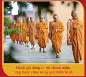
Hình ghi đang an cư chính niệm, thực hành niệm Phật trong giờ thiền hạnh.