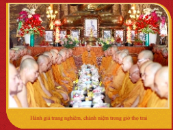
Hình ghi trong nghi thức, chính niệm trong giờ tọa.