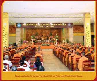
Khởi mạc khóa An cư Kiết hạ năm 2015 tại Pháp viện Minh Đăng Quang.