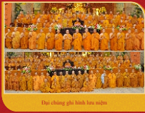
Đại chúng ghi hình học tập.

Trong các khóa Bồi dưỡng Trụ trì, chư Tôn đức Giáo hội, lãnh đạo Văn phòng 2 Trung ương đều đến thăm và sách dẫn đại chúng. Chư Tôn đức Giáo phẩm Hệ phái tùy theo chuyên đề của mỗi năm mà chia sẻ quan điểm của mình về Giáo pháp Phật và Tổ sư, để từ đó khẳng định con đường tu tập và hoằng pháp, góp phần vào sự ổn định, phát triển bền vững cho Hệ phái và cho ngôi nhà Phật giáo Việt Nam.